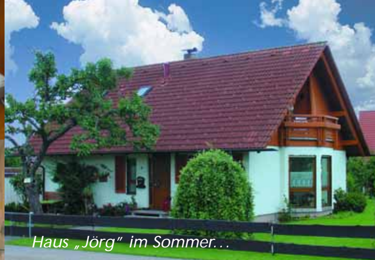
Haus „Jörg“ im Sommer...