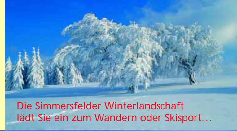
Die Simmersfelder Winterlandschaft lädt Sie ein zum Wandern oder Skisport...